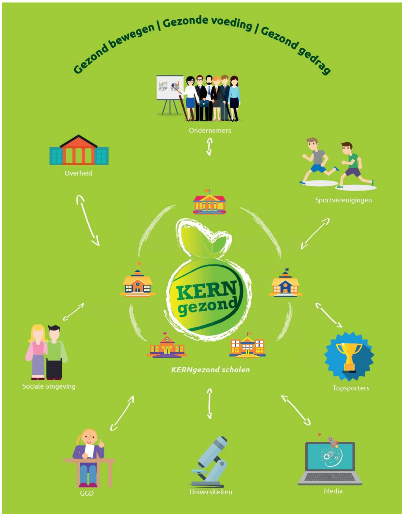
Figuur 1 Verbindingen binnen project KERNgezond F&F door Sport-Company